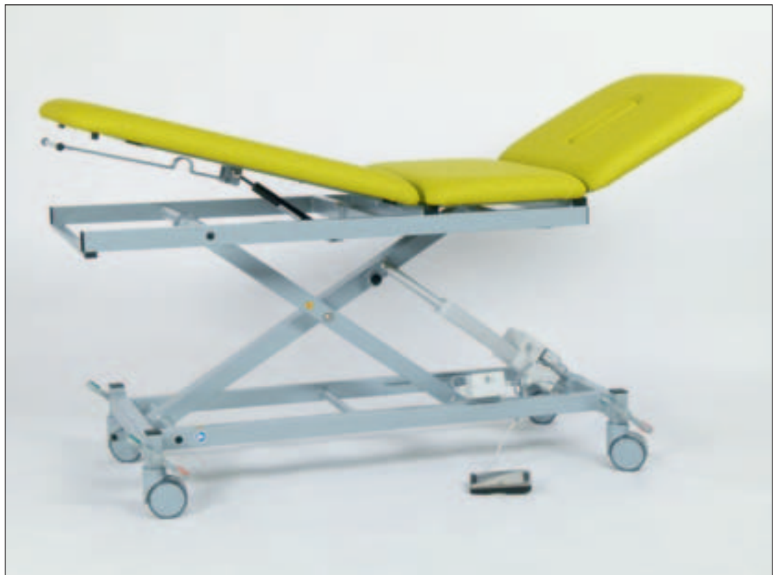
Beide Abb. Mod. 1050-04 mit Zubehör: Fahrbar auf 4 Doppel-Rollen \varnothing 100 mm, zentral feststellbar (Mod. 046)