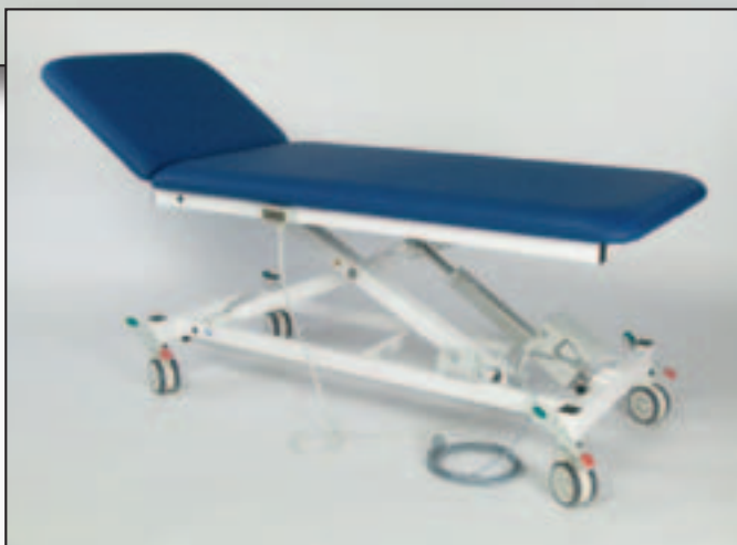
Abb. zeigt Grundausstattung

Abb. mit Zubehör: Fahrbar auf 4 Doppel-Rollen \varnothing 100 mm, Rollen komplett zentral bedienbar 1 Rolle mit Richtungsfeststellung (Mod. 046)